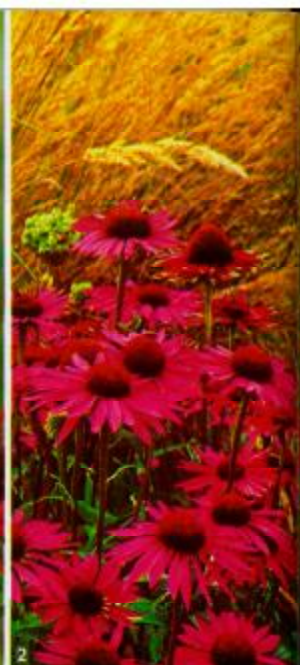
Echinacea 'Art's Pride'