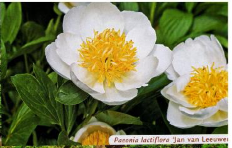
Paeonia lactiflora 'Jan van Leeuwen'